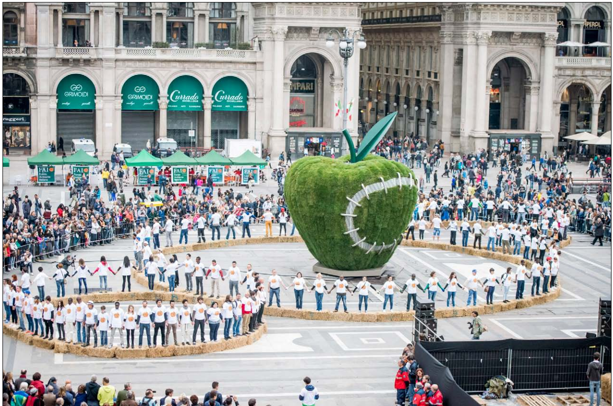
Terzo Paradiso, la Mela Reintegrata, Milano 2015